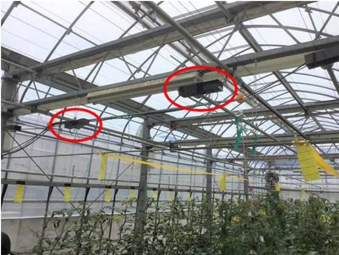
図1 磁歪材料による振動発生装置(東北特殊鋼株式会社製)をパイプに設置したトマト栽培施設(JA 全農内の展示圃場)