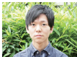
UEC 修学支援奨学生 総合情報学科3年

電通大には様々なことにチャレンジできる環境があり、最先端の研究や設備に実際に触れながら学ぶことができ、自分が興味を持ったことをしっかりと伸ばすことができたと思っています。また、奨学金を頂くことで勉学に集中でき、様々な活動を通じて個性豊かな友人に出会うことができたことも大変良かったと思っています。