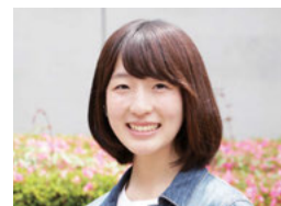
UEC WOMAN 修学支援特別奨学生 情報・通信工学科3年

大学とは学びの場であると同時に、大人として自立をする準備をする場でもあると思っています。UEC修学支援奨学金は、入学時の奨学金に加え授業料の免除と、とても充実した内容になっており、私自身、自立の第一歩として活用して大変良かったと思っています。